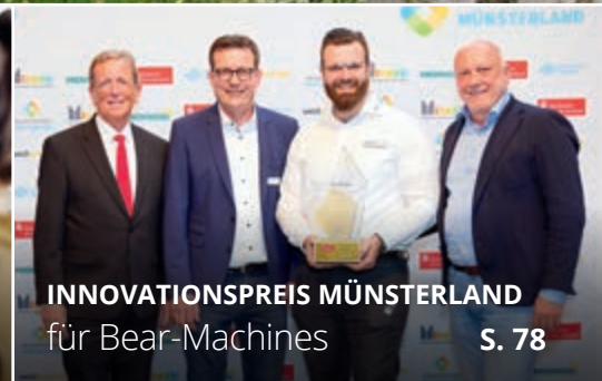
INNOVATIONSPREIS MÜNSTERLAND für Bear-Machines S. 78