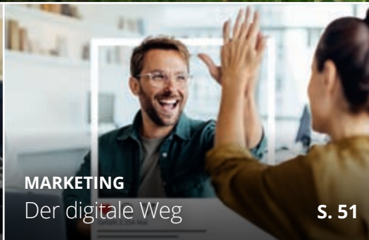
MARKETING Der digitale Weg S. 51